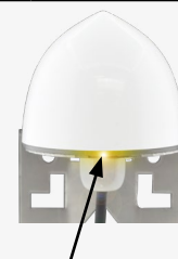
LED for synchronisation status indication LED pour le statut de la synchronisation LED für die Anzeige des Synchronisationsstatus LED indicador del estado de la sincronización

La posición de las señales en los conectores puede variar según los productos, así que confíe en los colores de los hilos según su función.