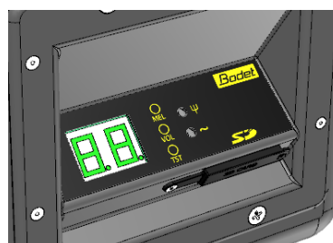
Clavier du carillon extérieur