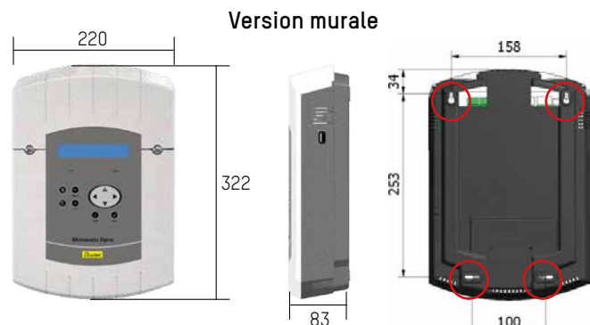
Poids : 1,2 Kg - Fixation murale avec 4 vis