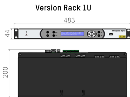
Poids : 1,4 Kg