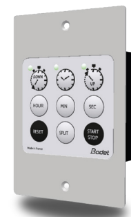
Pupitre Style Empotrado