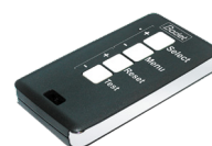
Mando a distancia HF