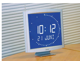
Opalys Ellipse auf einem Tischträger