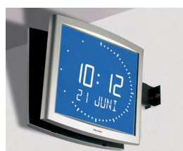
Opalys Ellipse auf einem doppelseitigen Halter