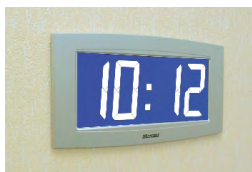
Opalys 14 auf einem Einbauträger

NTP Server sendet UTC Zeit regelmäßig über Ethernet Netzwerk. Die Nebenuhren stellen sich automatisch ein, nachdem sie mehrere kohärente nachfolgende Zeitnachrichten empfangen haben. Sie wählen auch automatisch die richtige Zeitzone. Der NTP Server muss eine Sendezeit (Poll) von unter 128 Sekunden haben.