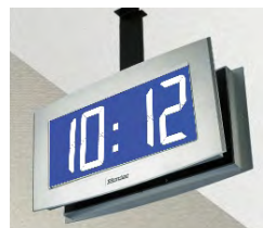
Opalys 14 auf einem doppelseitigen Halter